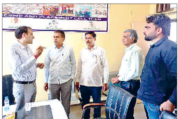
महेंद्रगढ़। मेले में उपस्थित कंपनी के अधिकारी।