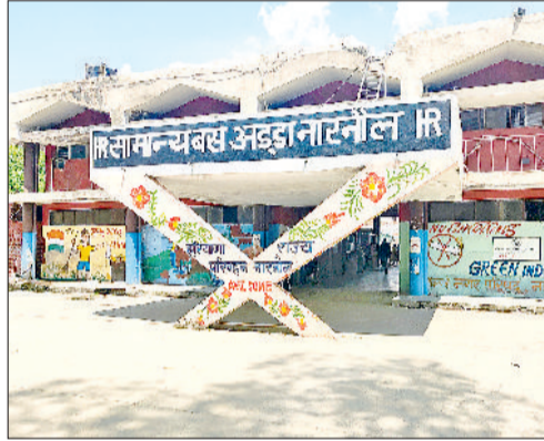
नारनौल। बस स्टैंड परिसर।

परिवहन विभाग की ओर से नारनौल से ग्रीन कॉरिडोर से 152 डी से होकर चंडीगढ़ जाने वाली बसों के समय बदलाव किया गया है। इससे पहले विभाग की ओर से चंडीगढ़ से वाया नेशनल हाईवे 152 डी होते हुए नारनौल आने वाली रोडवेज बसों का समय सारणी में बदलाव किया गया था। बसों के समय में बदलाव रेवाड़ी डिपो की ओर से वाया एनएच 152 डी होते हुए दो नई बसों का संचालन होने के बाद किया गया है। नारनौल से चंडीगढ़ 152-डी ग्रीन कॉरिडोर पर विभिन्न डिपो की ओर से बसों का संचालन किया जा रहा है, जिसमें नारनौल, चंडीगढ़, अंबाला, दादरी, कुरुक्षेत्र व यमुनानगर डिपो शामिल हैं। 152 डी ग्रीन कॉरिडोर से बसों का संचालन शुरू होने के बाद जिला कुरुक्षेत्र, कैथल, करनाल, जींद, रोहतक, भिवानी, चरखी दादरी व महेंद्रगढ़ जिले के यात्रियों को लाभ मिल रहा है। महेंद्रगढ़, दादरी, रोहतक से चंडीगढ़ रोडवेज बस में 410 रुपये किराया लगता है तथा महेंद्रगढ़ से 152 ग्रीन कॉरिडोर से रोडवेज बस में 370 रुपये किराया लगता है। ग्रीन कॉरिडोर 152 डिपो पर बसों का संचालन शुरू होने के बाद यात्रियों के समय में बचत होने के साथ-साथ जेब का भार भी कम हुआ है। पहले जिले के यात्रियों को स्टेट हाईवे 148 वी से चंडीगढ़ जाने में आठ घंटे का समय लगता था। वहीं अब जिले के यात्री चार घंटे में आसानी से चंडीगढ़ पहुंच रहे हैं।