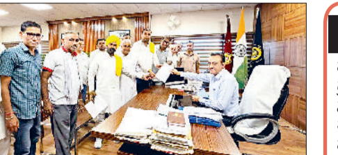
नारनौल। ज्ञापन सौंपते किसान।