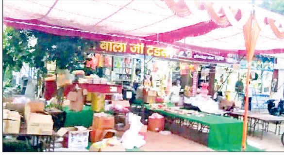
महेंद्रगढ़। दीपावली के लिए सजा बाजार।

वहीं अब दीपावली पर्व को लेकर बाजार में भी चलन-पहल बढ़ गई है। महिलाओं ने घर के कोनों-कोनों की सफाई में जुटना शुरू कर दिया है, ताकि धनतेरस और दिवाली तक सबकुछ चमक उठे। शहर के विभिन्न इलाके