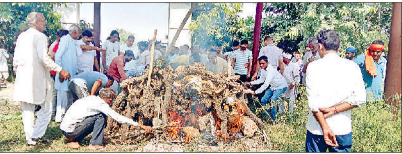
नारनौल। एकसाथ पिता-पुत्र का अंतिम संस्कार करते हुए।