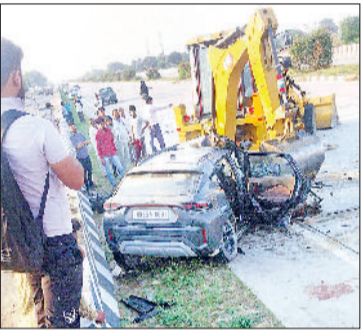
नारनौल। सड़क दुर्घटना में क्षतिग्रस्त कार।