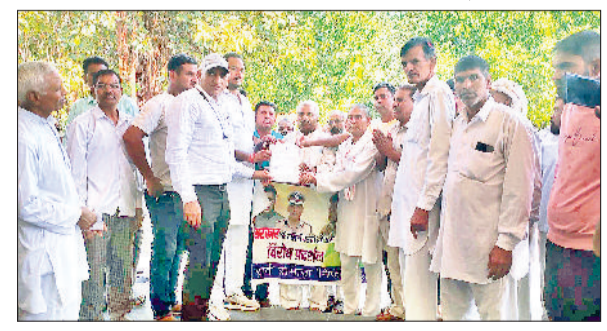
नारनौल। निजामपुर के बीडीपीओ को ज्ञापन सौंपते एससी समाज के लोग।